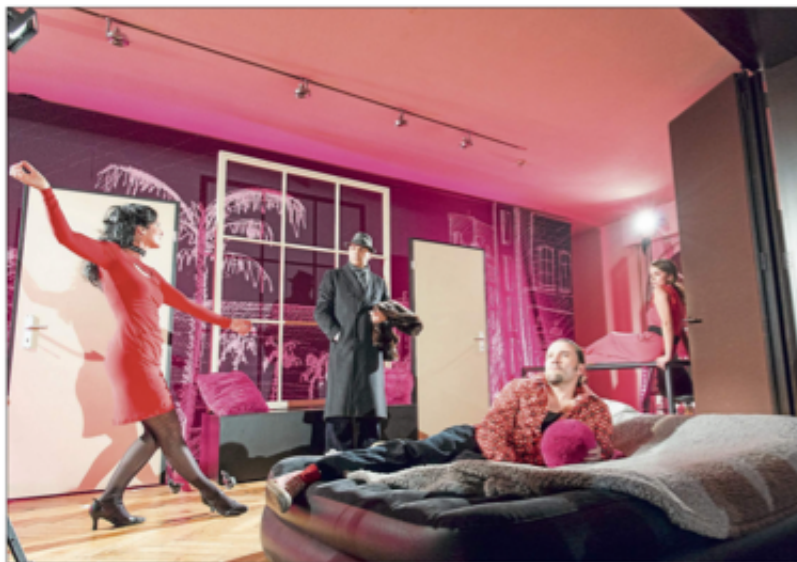
Das Gourmet-Theater in der Villa Behr mit vier Künstlern und vier Gängen.

Das Foursemble spielte durchweg sehr präsent, überzeugend und mit höchstem Einsatz. Dieser Einsatz ist auf dem Weg nach oben dringend nötig, denn er ist mit Eitelkeiten, Intrigen und Lügen gepflastert. Er führt zuweilen auch durch die Horizontalen, siehe das im Stück zitierte „MeToo“ und die Anklage gegen Harvey Weinstein. Das Stück übersteigt alles ins Groteske, immer wieder ist